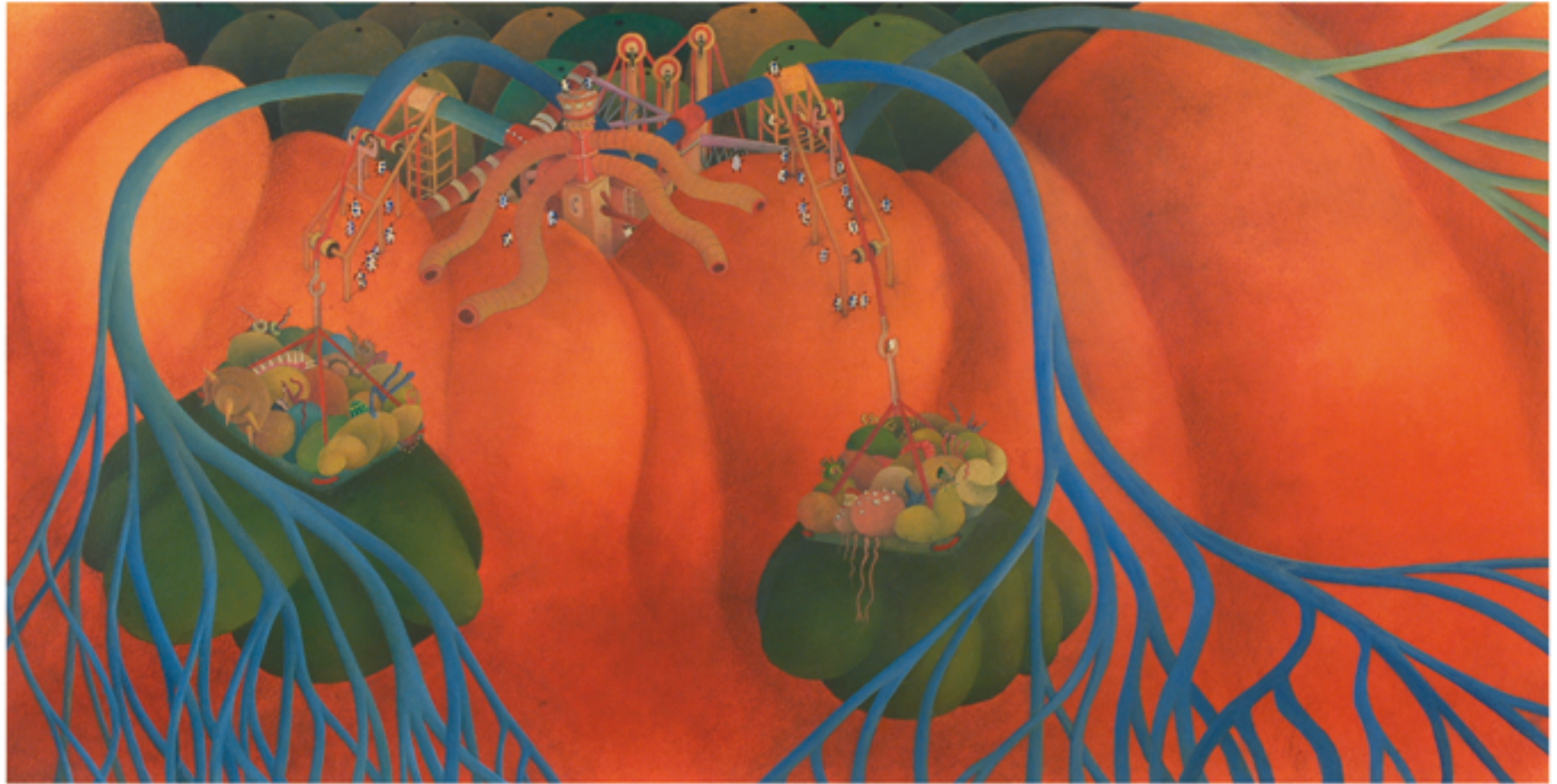
RECOGIENDO PROVISIONES | Acrílico sobre papel, 80 x 40 cms