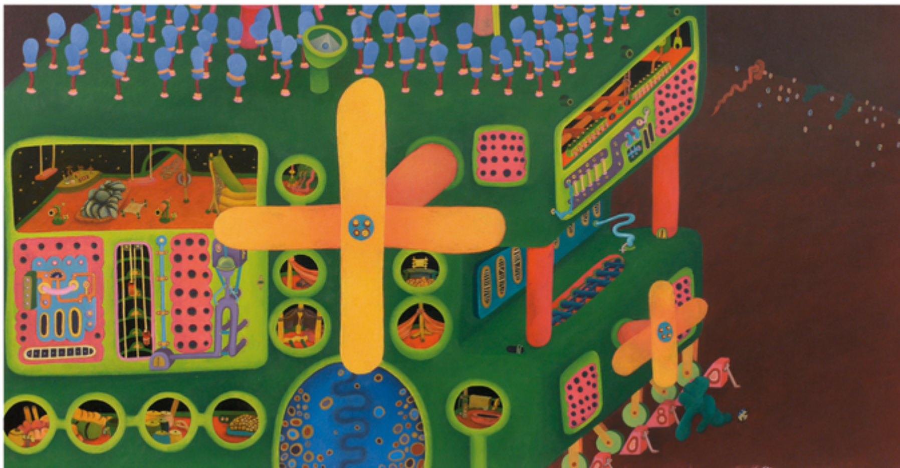
NAVE PARA IR AL MAR | Acrílico sobre papel, 80 x 40 cms