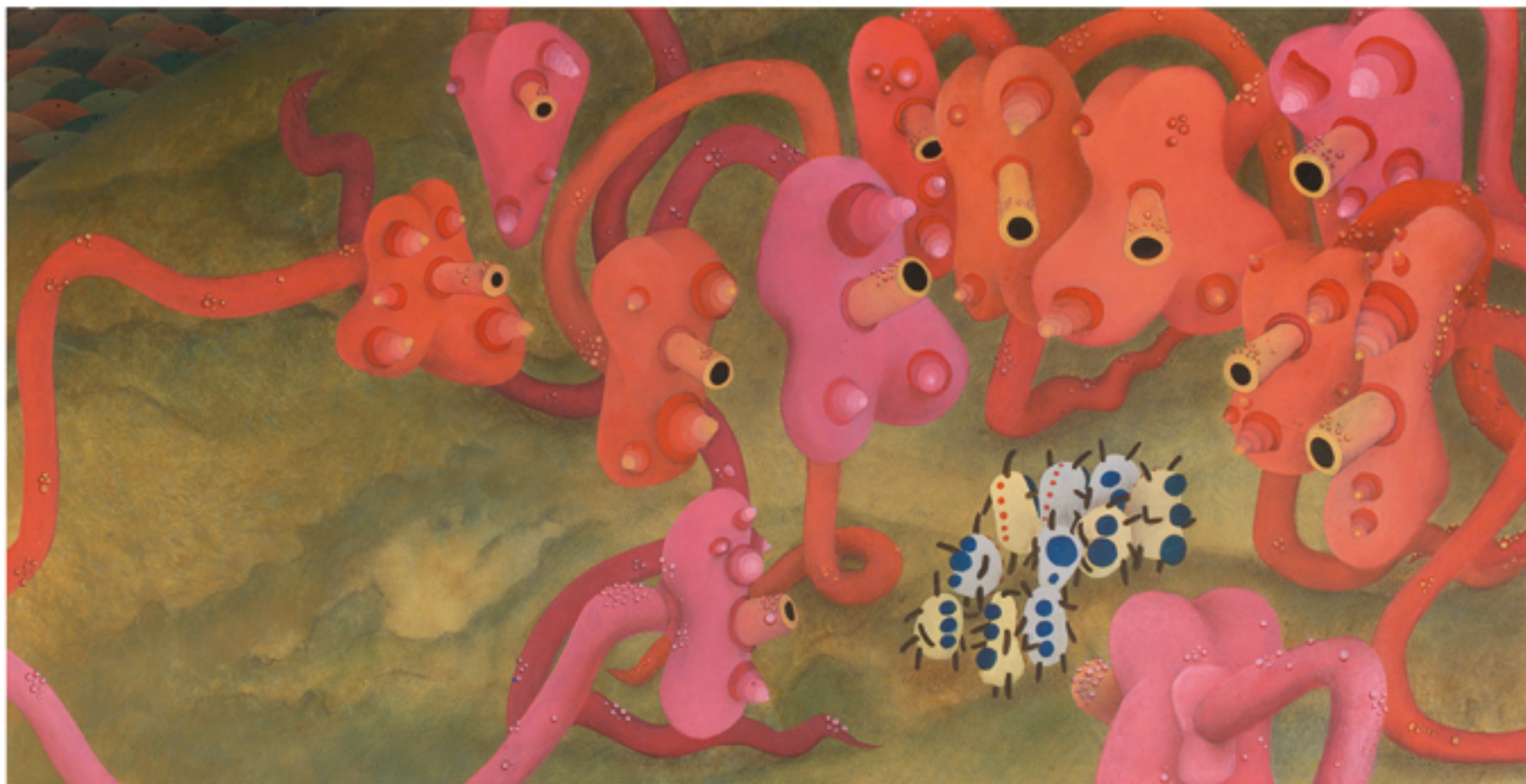
ENCUENTRO CON LOS HYMENOLEPIS NANA | Acrílico sobre papel, 80 x 40 cms

MEETING WITH HYMENOLEPIS NANA | Acrylic on paper, 80 x 40 cms